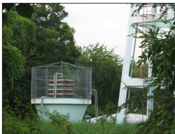
โครงการติดตามข่ายกันนก