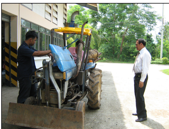
การเรียนรู้เกี่ยวกับเครื่องยนต์ของรถแต่ละประเภท