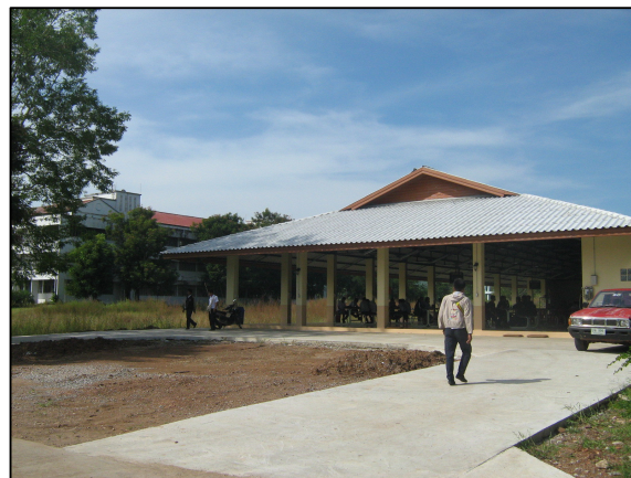
การเทพื้นคอนกรีตที่เสร็จสิ้นเป็นที่เรียบร้อยแล้ว