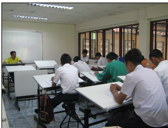
ความพร้อมของห้องเรียน วิชาเขียนแบบเทคนิค