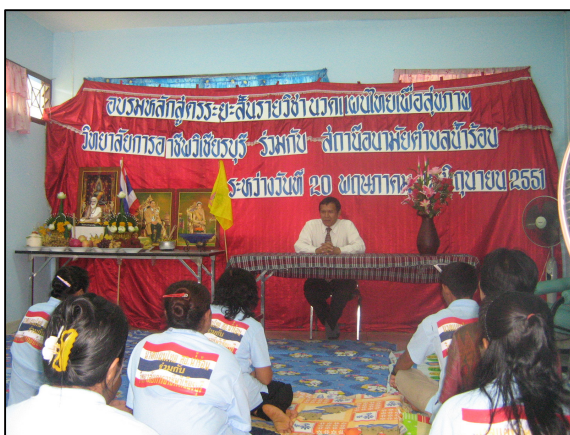
การเปิดสอนหลักสูตรระยะสั้น นวดแผนไทยเพื่อสุขภาพ