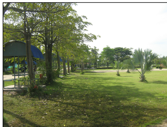
จัดทำซุ้มไว้อ่านวยความสะดวกเพื่อการพักผ่อน