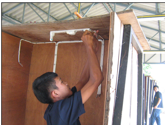
ชุดฝึกสอนของแผนกวิชาช่างไฟฟ้ากำลัง