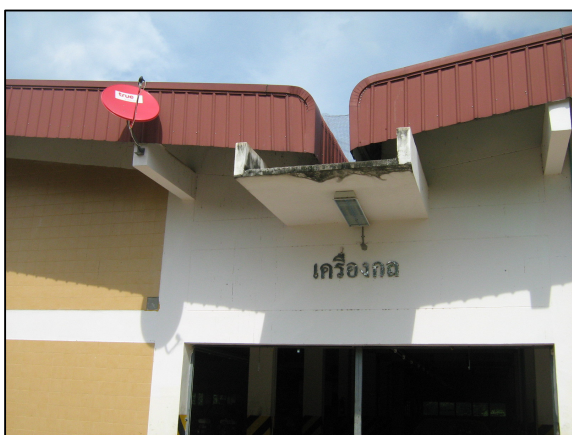
โครงการปรับปรุงระบบเทคโนโลยีสารสนเทศ