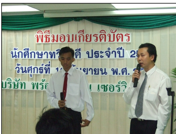
บ.พร้อมเทคโนโลยี เซอร์วิส มอบเกียรติบัตรให้กับนักศึกษา ระบบทวิภาคี ช่างไฟฟ้า รางวัลนักศึกษาตัวอย่าง