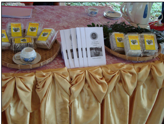
ชาขงสมุนไพร ของแผนกพัฒนวิชาการ