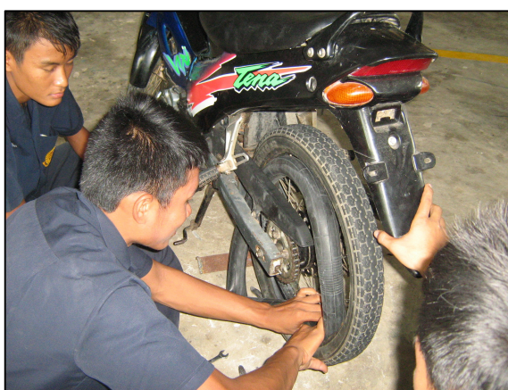
การเรียนรู้ในการซ่อมเกี่ยวกับงานยานยนต์ต่าง ๆ