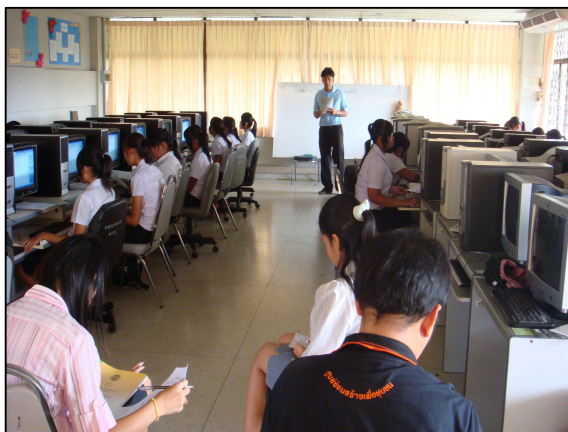
ห้องเรียนรู้ด้วยระบบเทคโนโลยีสารสนเทศ