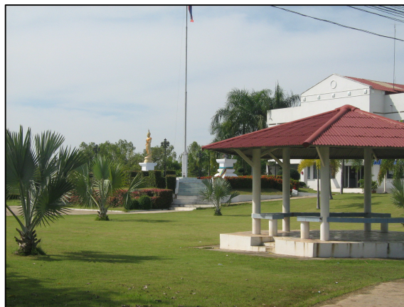
ภูมิทัศน์ทุกมุมของวิทยาลัยฯ ที่เลดูสวยงาม