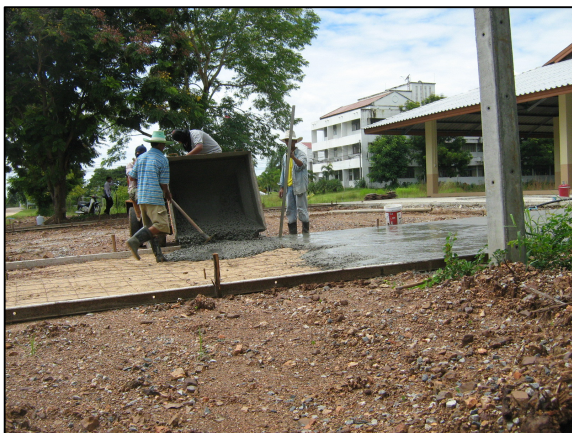
การเทพื้นคอนกรีตหน้าโรงอาหารหลังใหม่