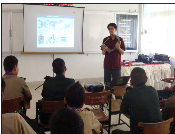
ห้องเรียนที่พร้อมด้วยสื่อในการนำเสนอในการสอน