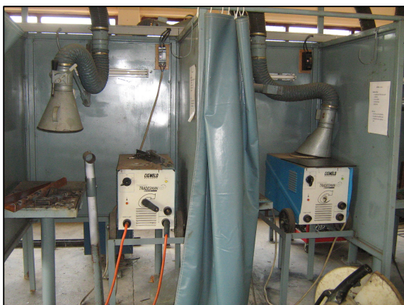
ครูภัณฑ์พร้อมอุปกรณ์แผนกวิชาเทคนิคพื้นฐาน