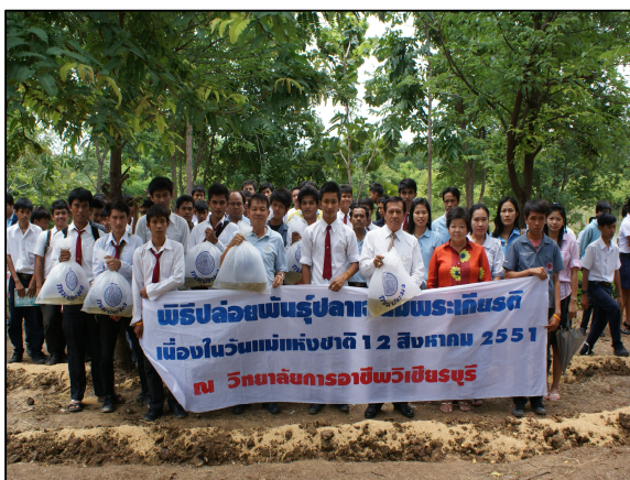
ผู้บริหาร นำคณะครู เจ้าหน้าที่ และนักเรียน นักศึกษา ปล่อยพันธุ์ปลาเฉลิมพระเกียรติเนื่องในวันแม่แห่งชาติ