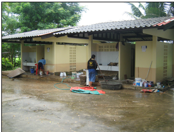
การปรับปรุงห้องน้ำแผนกวิชาช่างไฟฟ้ากำลัง