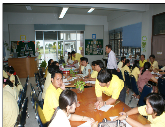
วิทยาลัยฯ จัดประชุมเพื่อปรึกษาหารือร่วมกันพัฒนาและ แก้ไขปัญหาต่าง ๆ