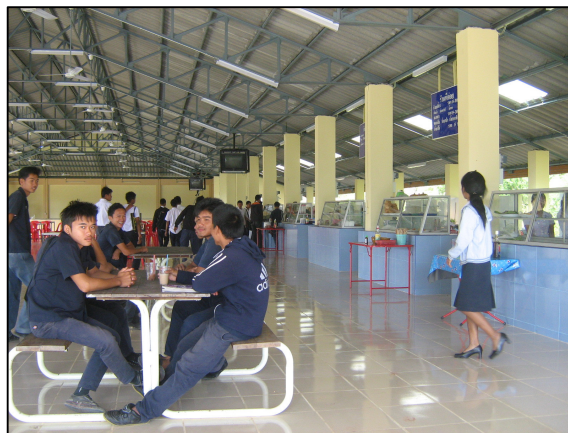
โรงอาหารหลังใหม่ของวิทยาลัยฯ ที่สวยงามและน่าใช้บริการ