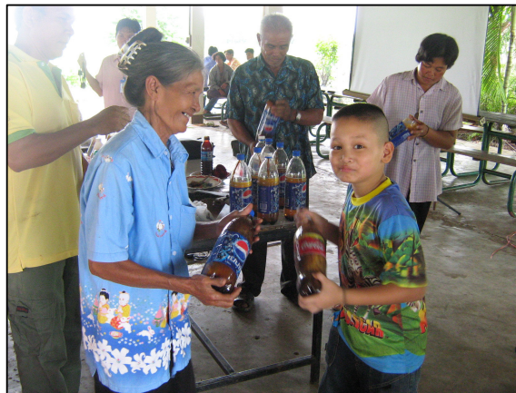
การขับเคลื่อน ปรัชญาเศรษฐกิจพอเพียงในสถานศึกษา ให้ความรู้กับชุมชนในการดำเนินชีวิตตามหลักเศรษฐกิจพอเพียง