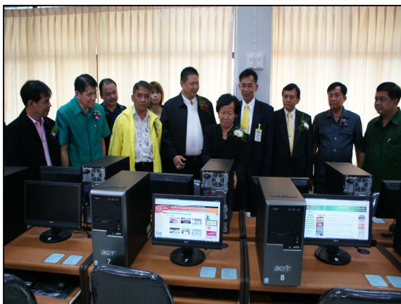
ความพร้อมของห้องเรียนรู้อิเล็กทรอนิกส์ที่ทันสมัย