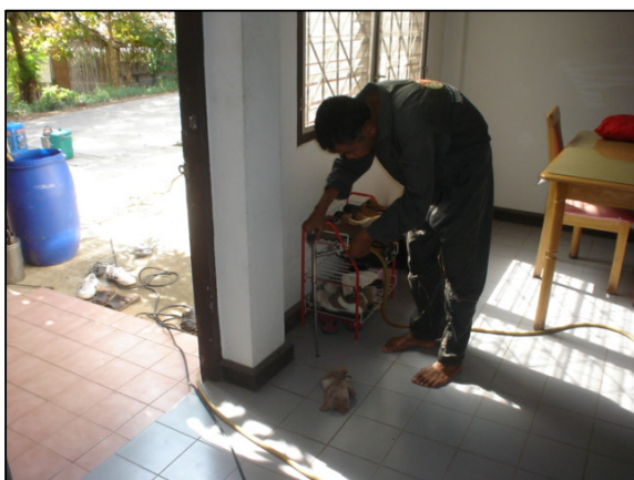
โครงการกำจัดปลวกวิทยาลัยฯ