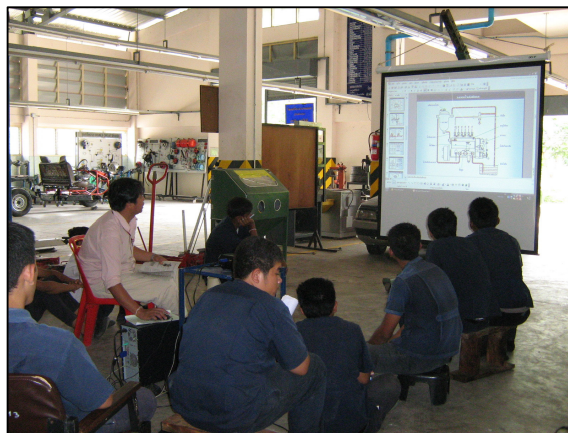
ครูภัณฑ์ที่ทันสมัยในการจัดการเรียนการสอน