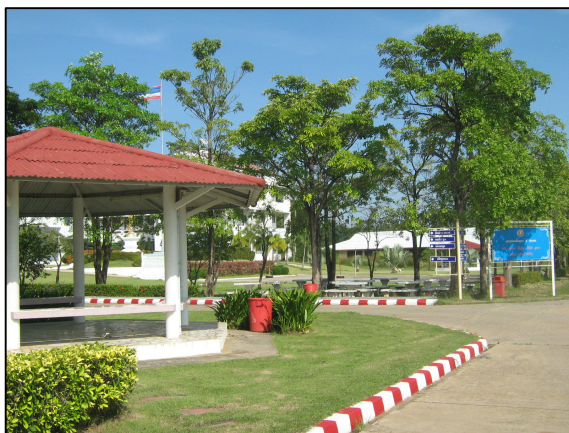
ขอบถนนภายในวิทยาลัยฯ ที่ได้รับการปรับปรุงให้สวยงาม