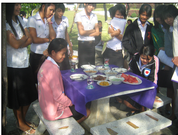
การเรียนรู้นอกจากทฤษฎี โดยการสมมติให้เสมือนจริง