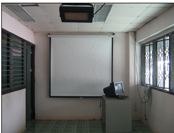
ห้องสื่อโสตฯ ของแต่ละแผนกที่มีไว้ใช้ในการทำการสอน