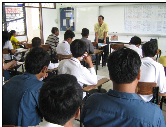
ปฐมนิเทศผู้ปกครอง และนักศึกษาเพื่อเตรียมฝึกประสบการณ์