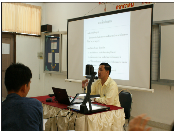
โครงการพัฒนาทักษะการเขียน โครงการ และหนังสือราชการ