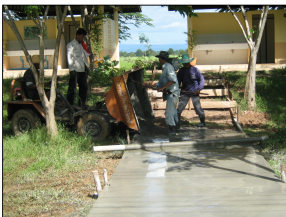
การเทพื้นคอนกรีตทางเข้าห้องน้ำ