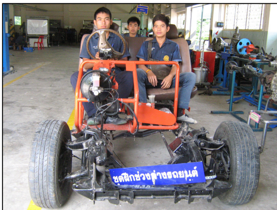
ชุดฝึกสอนของแผนกวิชาเครื่องกล