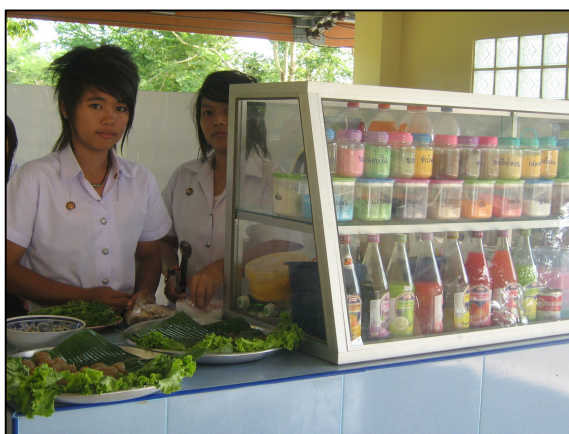
การดำเนินธุรกิจขนาดเล็ก ในรายวิชาโครงการวิชาชีพ