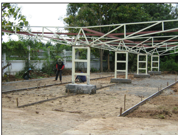
ขั้นตอนการจัดทำโรงจอดรถนักเรียน นักศึกษา