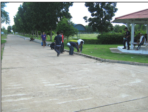
การปรับปรุงขอบถนนภายในวิทยาลัยฯ