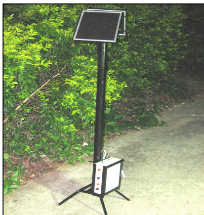
เครื่องกำเนิดกระแสไฟฟ้า ของแผนกวิชาช่างไฟฟ้ากำลัง