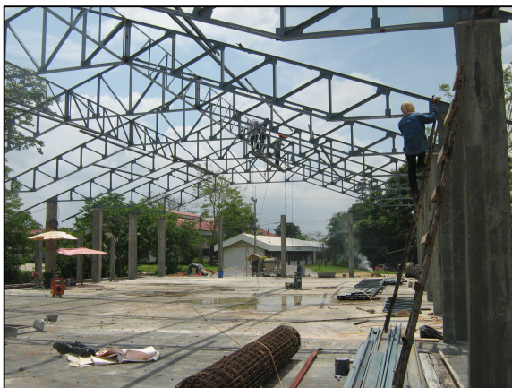
การจัดสร้างโรงอาหารหลังใหม่