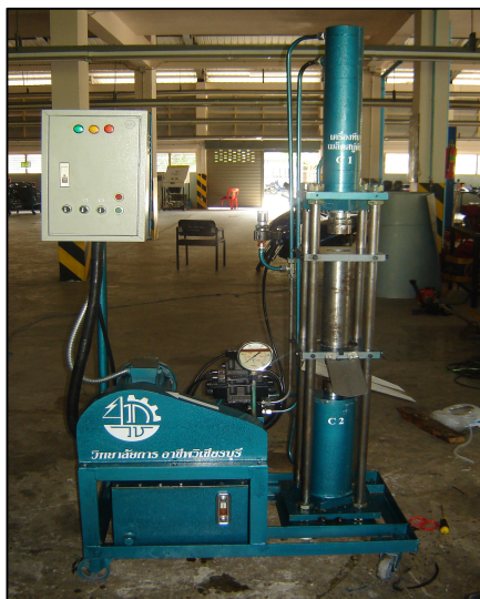
เครื่องหีบเมล็ดสบู่ดำ ของแผนกวิชาเครื่องกล