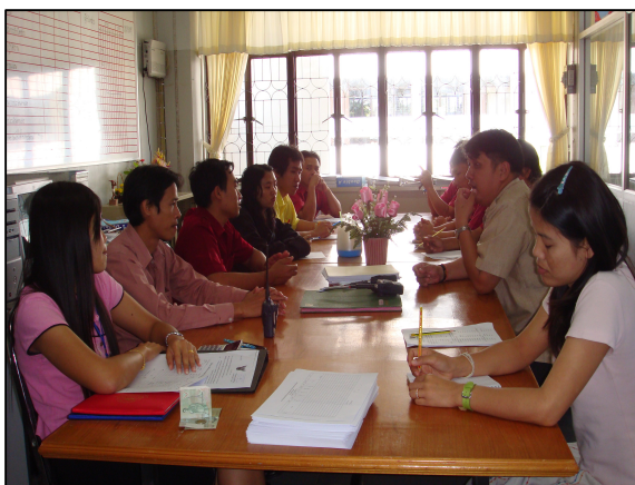
หน่วยงานภายในวิทยาลัยฯ ที่ประชุมปรึกษาหารือ เกี่ยวกับการทำงานของงานนั้น ๆ