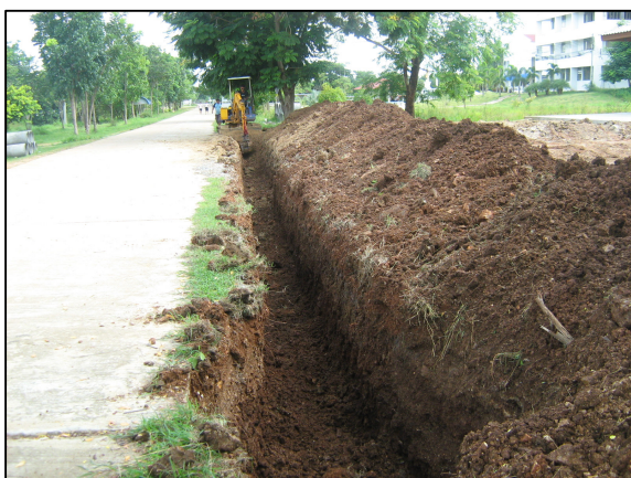
โครงการจัดทำร่องระบายน้ำบริเวณหน้าโรงอาหารใหม่