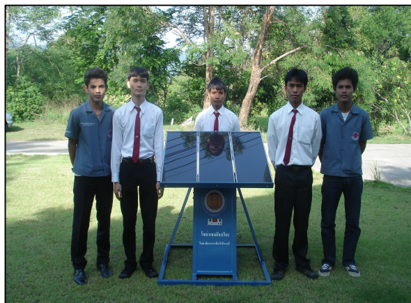
โซล่าเซลล์อัจฉริยะ ของแผนกวิชาเทคนิคพื้นฐาน