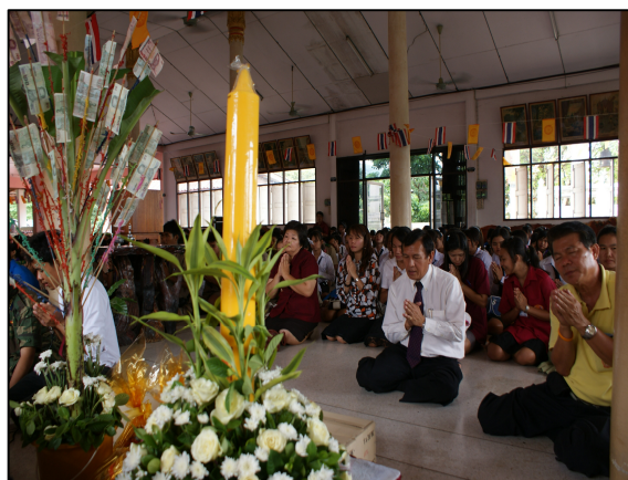
ผู้บริหาร นำคณะครู เจ้าหน้าที่ และนักเรียน นักศึกษา ร่วมทำบุญ และถวายเทียนพรรษา