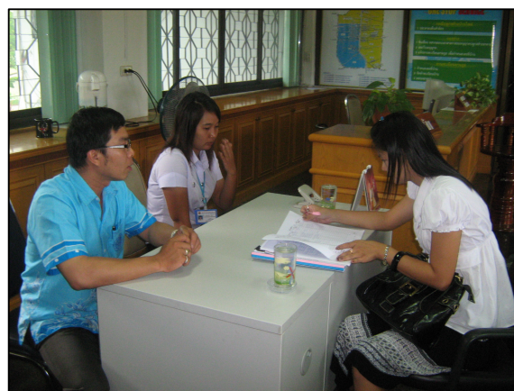
ครูออกนิเทศนักศึกษาฝึกประสบการณ์