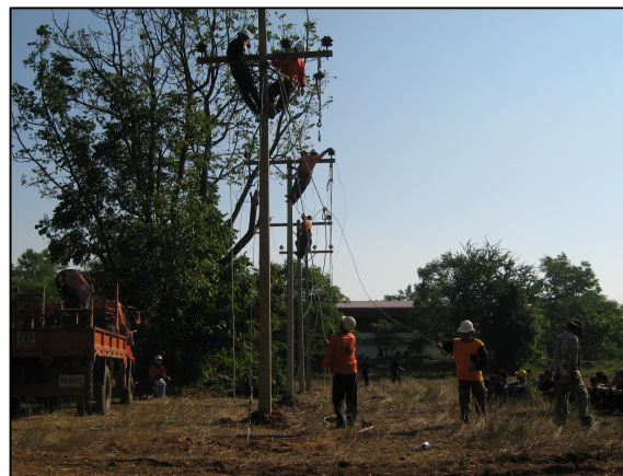
การเรียนรู้ในรายวิชาการติดตั้งไฟฟ้านอกอาคารที่ได้ปฏิบัติงานจริง