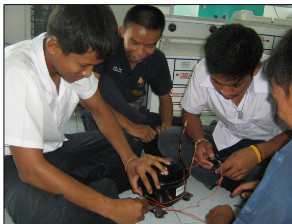
วัสดุอุปกรณ์ที่สามารถปฏิบัติได้เหมือนจริง