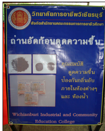
ถ่านอัดก้อนดูดความชื้น ของแผนกวิชาสามัญสัมพันธ์