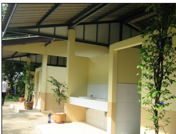
ห้องน้ำข้างโรงอาหารหลังเก่าที่ได้รับการปรับปรุง