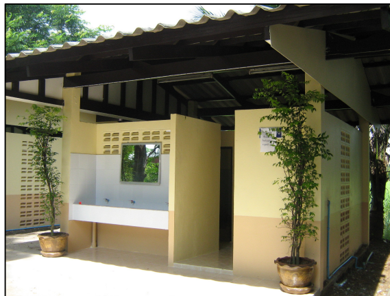
ห้องน้ำแผนกวิชาช่างไฟฟ้ากำลังที่ได้รับการปรับปรุง