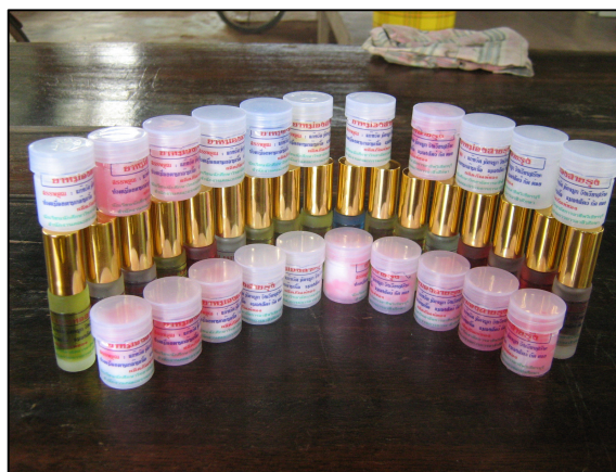
โครงการส่งเสริมการเรียนรู้ตามอัธยาศัย (108 อาชีพ)