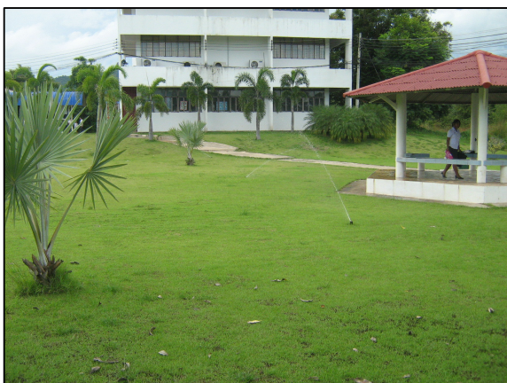
การดูแลรักษา พัฒนาภูมิทัศน์ให้สวยงามอยู่ตลอดเวลา