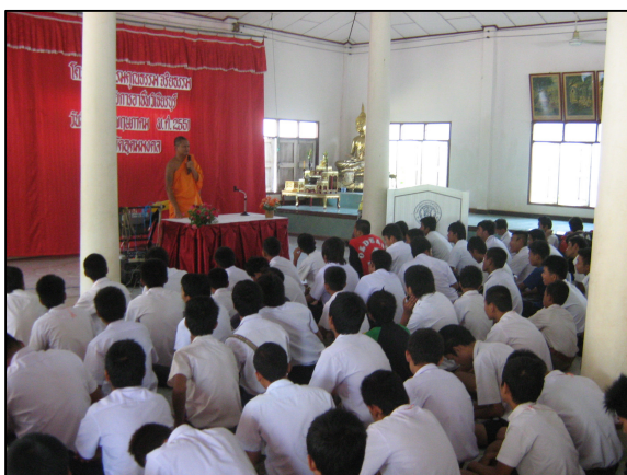
โครงการอบรมคุณธรรม จริยธรรม นักเรียนชั้นปีที่ 1