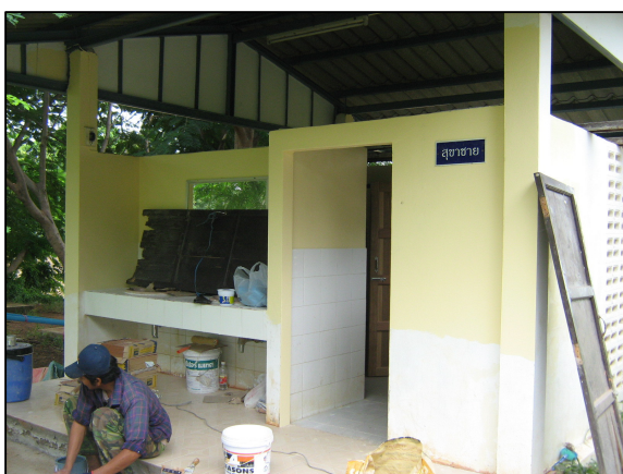
การปรับปรุงห้องน้ำข้างโรงอาหารหลังเก่า