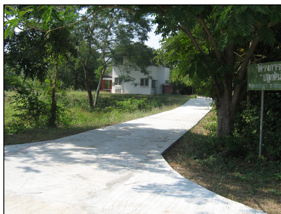
โครงการเทพื้นถนนคอนกรีตภายในวิทยาลัยฯ