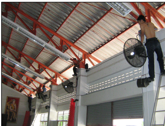
การบูรณาการการจัดการเรียนการสอนที่ปฏิบัติงานจริง