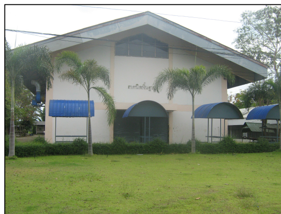
การปรับปรุงภูมิทัศน์หน้าแผนกวิชาเทคนิคพื้นฐาน