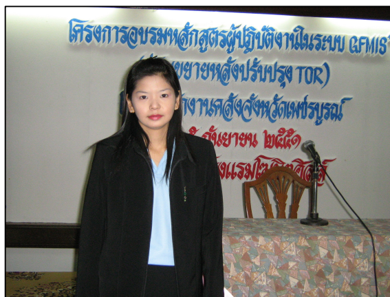
บุคลากรงานการเงิน เข้าร่วมการอบรมหลักสูตรปฏิบัติงาน ในระบบ GFMIS