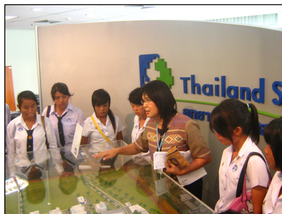
โครงการทัศนศึกษาดูงาน นักศึกษาชั้นปีที่ 1 แผนกพาณิชย์การ