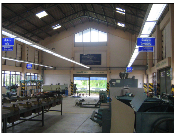
พื้นที่และครุภัณฑ์ที่พร้อมในการจัดเรียนการสอน