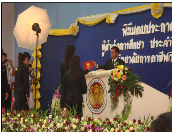
โครงการพิธีมอบประกาศนียบัตร ของวิทยาลัยฯ