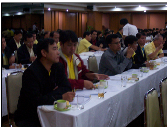
ผู้บริหารและบุคลากร ฝ่ายแผนฯ เข้าร่วมประชุมการจัดทำ แผนปฏิบัติการราชการ 4 ปี