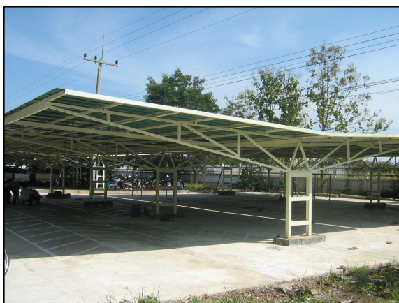
โรงจอดรถนักเรียน นักศึกษา ที่เสร็จสิ้นเป็นที่เรียบร้อยแล้ว