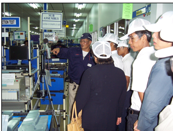
โครงการทัศนศึกษาดูงาน นักศึกษาชั้นปีที่ 1 แผนกวิชาช่างไฟฟ้ากำลัง