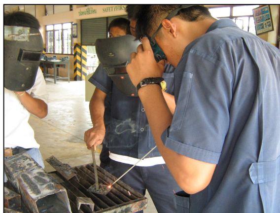
อุปกรณ์ป้องกันความปลอดภัยในการเรียนภาคปฏิบัติ