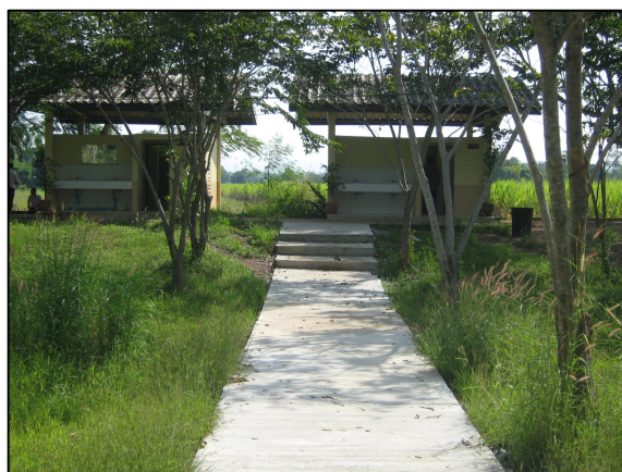
การเทพื้นคอนกรีตทางเข้าห้องน้ำที่เสร็จสิ้นเป็นที่เรียบร้อยแล้ว