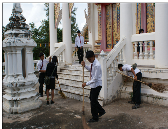
นักเรียน นักศึกษา ร่วมบำเพ็ญประโยชน์ที่วัดอุดมมงคล ตำบลสามแยก อำเภอเวียงบุรี จังหวัดเพชรบูรณ์