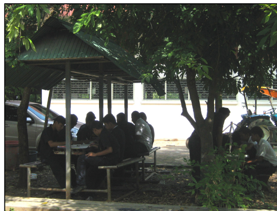
จัดทำซุ้มสำหรับนักเรียน นักศึกษาแผนกเครื่องกล