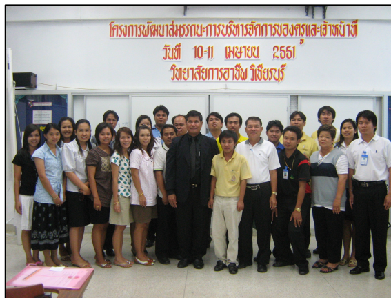
โครงการพัฒนาสมรรถนะการบริหารจัดการของครู และเจ้าหน้าที่